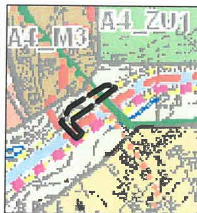
GRANICA OBSZARU OBJĘTEGO MIEJSCOWYM PLANEM ZAGOSPODAROWANIA PRZESTRZENNEGO TERENY ŁĄCZNIKÓW EKOLOGICZNYCH

obszar planu znajduje się w granicach: - strefy ochrony pośredniej od ujęcia wody Mosina-Krajkowo - GZWP nr 150 "Pradolina Warszawa-Berlin"