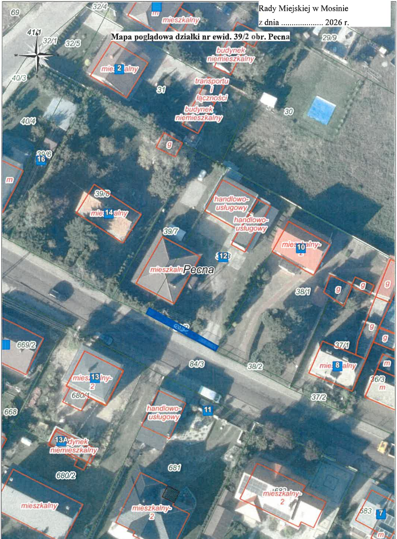
Mapa poglądowa działki nr ewid. 39/2 obr. Pecna

Załącznik do uchwały nr ..... Rady Miejskiej w Mosinie z dnia ..... 2026 r.