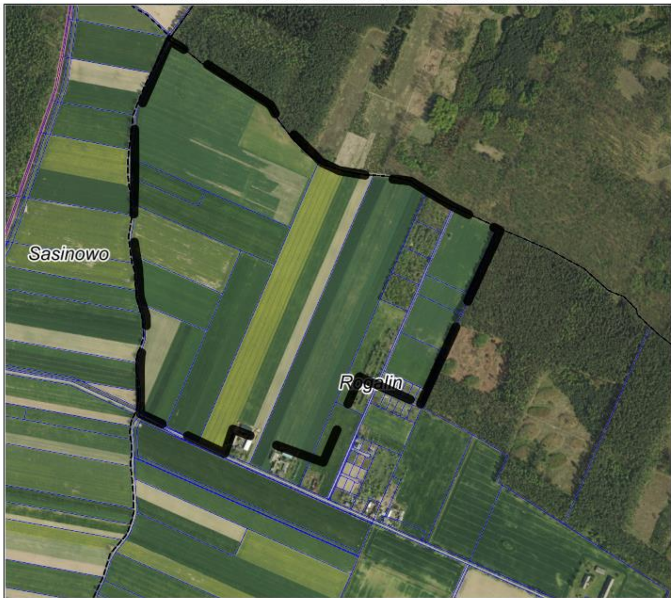
Ryc. 2 Proponowana granica obszaru na tle ortofotomapy

Urząd Miejski w Mosinie Pl. 20 Października 1 62-050 Mosina www.mosina.pl